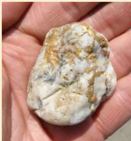
“Geijo” de cuarzo aurífero.

El pasado mes de marzo, la Junta de Castilla y León ha autorizado a la Compañía Europea de Rocas y Minerales (CERM) a realizar una investigación prospectiva minera (por tres años) para buscar oro en ocho municipios de Montañas del Teleno.