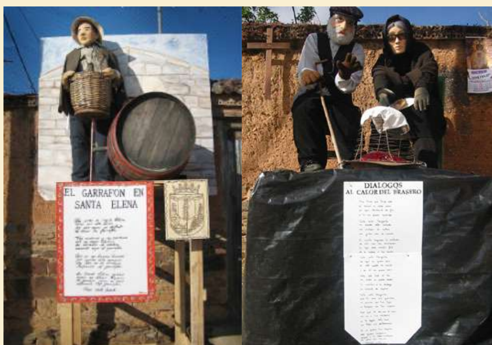
Mayo de Jiménez de Jamuz

Los “mayos” captan artísticas escenas de la vida y costumbres del pueblo, adornadas siempre con un fino sentido del humor reflejado en las leyendas que los acompañan; al verlas, podríase decir que son pequeñas fallas, cuyo valor artístico es incuestionable.