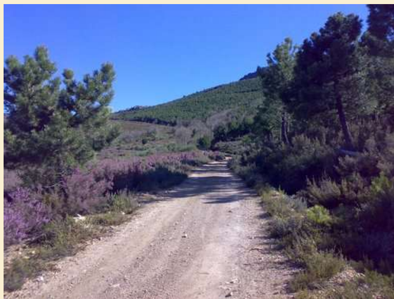
Pista forestal en los pinares de la Sierra del Teleno

La Universidad de León (ULE) en coordinación con la Universidad de Santiago de Compostela y el Centro de Investigación de Estudios Ambientales del Mediterráneo (CEAM) de Valencia, están llevando a cabo el proyecto “ Gesfire ”. Esta iniciativa supone la aplicación de la tecnología de los drones para obtener imágenes y tomar datos que permitan evaluar y predecir la recuperación vegetal en ecosistemas forestales afectados por grandes incendios, como son los pinares y, en concreto, nuestros castigados montes de la Sierra del Teleno, Monte Pindo, en La Coruña y Cortes de Pallás, en Valencia, que están conformados por la especie Pinus