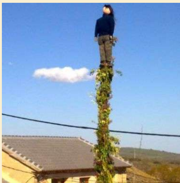
Mayo tradicional en Montañas del Teleno

Sin embargo, de todas ellas sólo vamos a profundizar en “los mayos” por la evolución que han seguido en algunos enclaves de Montañas del Teleno donde han llegado a alcanzar verdadero valor artístico además de todos los etnográficos, culturales y antropológicos que ya tenían; si bien, hay que lamentar que en buena parte del territorio la tradición se ha perdido.