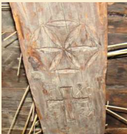
Hexafolia tallada en madera junto a una cruz

el dominio de la divinidad suprema -representada por el sol-, lo que indica una concepción astral de la otra vida. Blázquez mantiene que las esvásticas y las rosáceas que coronan las estelas hispano-romanas representaban al sol y al rayo, estando asociadas al culto a Júpiter, dios supremo de los cielos y de la tormenta que, por el fenómeno del sincretismo religioso, se asoció al dios al que los indígenas adoraban en las cumbres de las montañas, en este caso, Tilenus. En el territorio de los astures y de los cántabros se tiene constancia de la existencia de un Júpiter Cantábricus y del culto a Taranis ; pero, concretamente, en este entorno de La Maragatería, más que el culto a Júpiter como divinidad de las tormentas, se considera que las hexafolias simbolizan a Marte y más concretamente a la divinidad sincrética de Marti Tilenus .