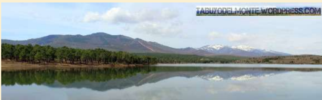
Vista del embalse del Río Valtabuyo.

En el entorno privilegiado del embalse de Tabuyo del Monte, el día 4 de julio, tuvo lugar la 2ª prueba del XX Campeonato Regional de Edad de Piragüismo de Castilla y León (puntuable para el XIII Campeonato Copa Junta).