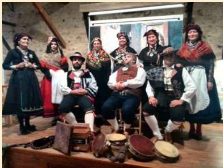
Grupo de Cultura Tradicional Serano

También pudo admirarse una interesante selección de instrumentos musicales propios de El Bierzo, Laciana, la montaña, el Páramo (pandero cuadrado, el redoblante, la dulzaina, la pandereta, la gaita leonesa, el acordeón diatónico, el acordeón cromático y las castañuelas).