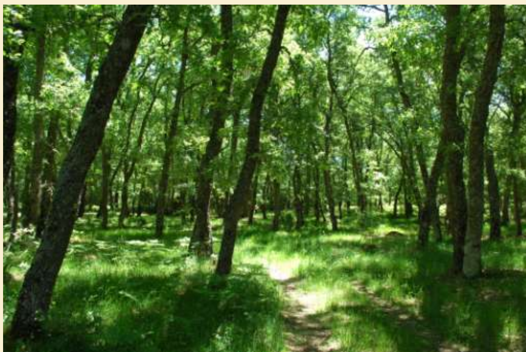
Tabuyo del Monte.

No sólo es necesario tener buenas intenciones... en materia de preservar nuestros montes, es necesario actuar de inmediato y de forma decisiva.