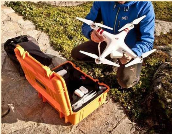
Vehículo aéreo no tripulado (VANT) o dron

Todo Montañas del Teleno, es un yacimiento arqueológico de época de la dominación romana por la búsqueda del oro del subsuelo. Sin embargo, con el paso de los años, los indicios de esta extracción masiva y febril se han difuminado, sobre todo en aquellas zonas como La Valdería donde, dadas las características geológicas, las infraestructuras se erigieron en materiales deleznales.