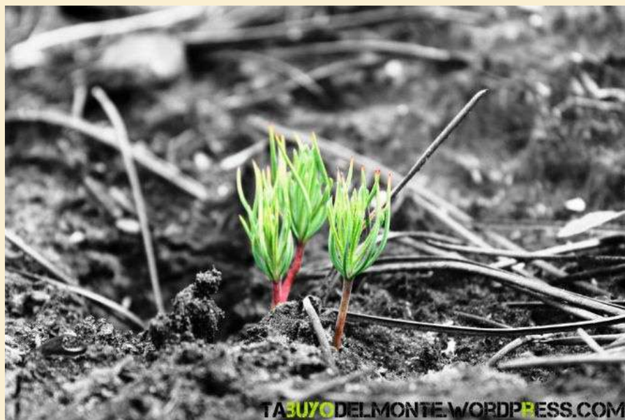
La lucha de la naturaleza por su regeneración

https://www.facebook.com/plataformaincendio.delteleno