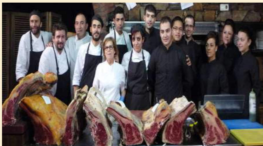
El equipo de cocina y servicio en sala de la Bodega El Capricho.