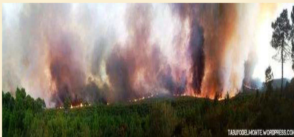
Las llamas arrasando uno de los valles afectados en el incendio de 2012

Pero, no acabó aquí el desastre; ya que, desgraciadamente, en pleno proceso de recuperación, el 20 de Agosto de 2012, se volvió a desatar sobre esta sierra “lo más parecido al infierno que podemos imaginarnos”. Un sonido atronador, un fuerte viento con un humo asfixiante y cegador, junto a unas llamas de hasta 50 metros de altura devoraron todo lo que encontraron a su paso, dejando un paisaje desolador.