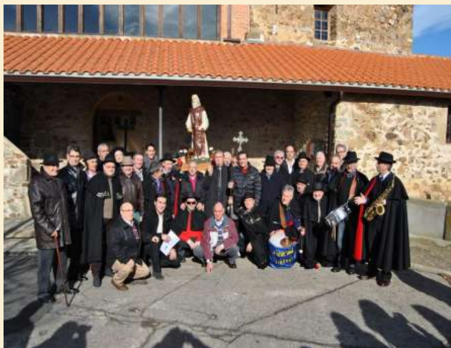
Los cofrades de San Antón jiminiegos con la imagen.

Hoy, de aquellas celebraciones apenas quedan manifestaciones como las misas y procesiones con el santo (Jiménez de Jamuz, Quintanilla de Somoza, Villarnera), la bendición de los animales de compañía, las subastas de cerdos (La Bañeza), partes del cerdo (Astorga) y el reparto de panecillos u hogazas (Castrocalbón).