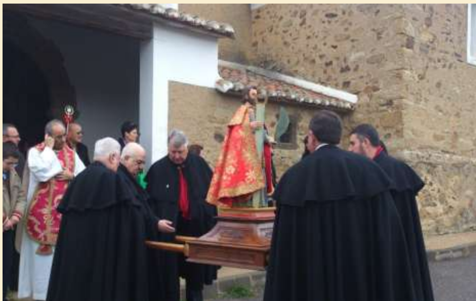
Cofrades sacando a Santo Tirso en Piedralba.

acompañados por la música de la flauta y el tamborín como es menester en cualquier festejo maragato. Comienzan con un “concierto” de repique de campanas mientras se conduce el cetro a la iglesia, para seguidamente comenzar la procesión de la imagen del santo portada por sus cofrades ataviados a la antigua usanza y la santa misa. Tras los actos religiosos no falta el convite para todos los asistentes y un animado baile del folclore tradicional.