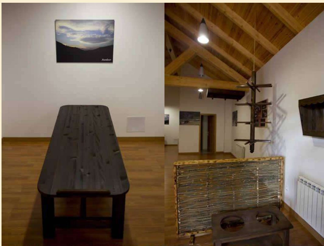
Dos aspectos del Centro.

Y es que para que una infraestructura de este tipo sea un ejemplo transferible y viable, no es necesario que tenga unas grandes dimensiones y que su coste haya sido elevado, sino que sea culturalmente útil, rentable, con carácter de bien social y generadora de sinergias tanto productivas como no productivas, lo cual cumple este modesto centro.