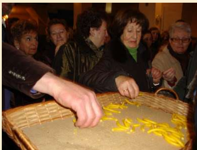
Devotos recogiendo “las cerillas” de San Blas.

También en La Bañeza, se honra solemnemente a San Blas. Su cofradía de la cual se tienen ya noticias en el siglo XVII (año 1648) es la encargada de rendirle homenaje. El ceremonial comprende una serie de actos litúrgicos que comienzan con una novena en la Iglesia de Santa María que se inicia el 31 de enero y culmina con una misa con procesión de la imagen por diversas calles de la ciudad (A esta procesión asisten también las “ samblasinas ”, variante de cofradía femenina, compuesta por hermanas y esposas de los cofrades), el traspaso del cetro del santo entre el juez saliente y el entrante y el reparto las “cerillas” (trocitos de cera que se entregan a los cofrades y devotos asistentes, previo donativo para el santo), con esta fórmula: “Por la intercesión y los méritos de San Blas, obispo y mártir, Dios os libre de los dolores de garganta y de cualquier otro mal”, ya que es creencia arraigada que dicho trozo de cera, colocado alrededor de la garganta preserva de las enfermedades del aparato respiratorio, contra las afecciones de la voz y otras dolencias relacionadas).